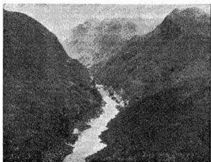
Paisagem de Cabora Bassa onde está a ser construída a barragem

Nota curiosa: a água contida no lago de Cabora-Bassa daria para abastecer a população actual de Lisboa durante mil anos.