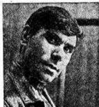
JOAQUIM AGOSTINHO, brilhante vencedor em 1970