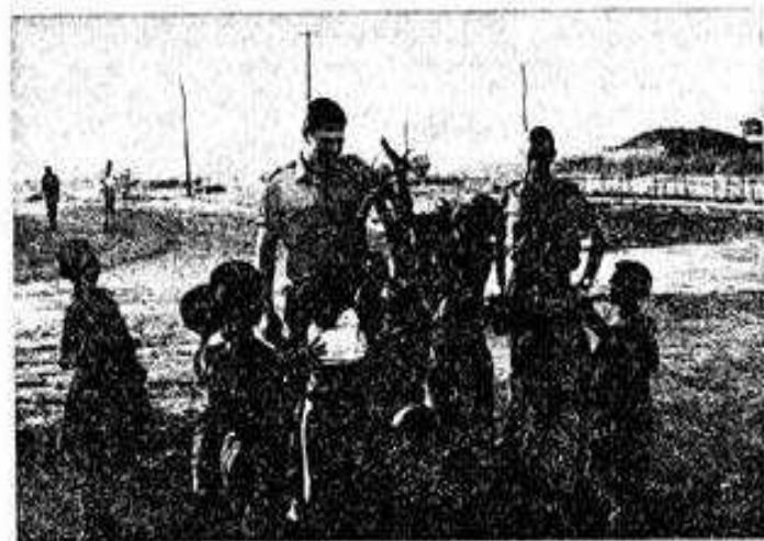
CONQUISTAR AS POPULAÇÕES É VENCER A GUERRA

Durante a cerimónia de entrega da Bandeira Nacional às for-